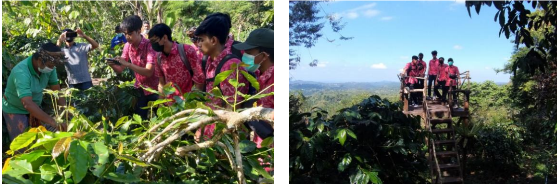
Gambar 1. Atraksi Wisata Berbasis Pertanian di Desa Adat Tinggan

dilengkapi dengan tempat pertemuan dan toilet. Sarana penunjang tersebut dibangun melalui bantuan program CSR Bank BCA. Kondisi beberapa sarana ini sudah rusak dan terbengkalai karena terkendala biaya pemeliharaan.