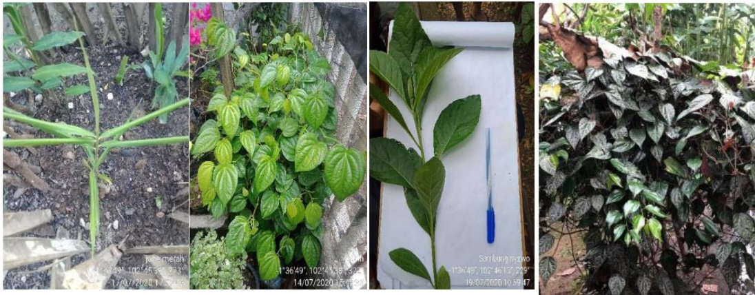
Gambar 1. Tumbuhan yang dimanfaatkan sebagai obat: (a) Jahe merah, (b) sirih, (c) Sambung nyawo, dan (d) Sirih merah

Nilai ICS dianalisis berdasarkan banyaknya kegunaan dan kepentingan pemanfaatan tumbuhan bagi masyarakat, dengan pendekatan alokasi subyektif peneliti. Turner (1988), menyatakan bahwa semakin banyak kebutuhan penggunaan suatu tumbuhan maka akan semakin besar kepentingan dari tumbuhan tersebut. Berdasarkan hasil analisis tersebut, jahe merah ( Zingiber officinale ) memiliki nilai ICS tertinggi yaitu 66, hal ini dapat dipengaruhi oleh nilai kualitas, intensitas, dan eksklusivitas dari spesies jahe merah di Desa Teluk Rendah yang tinggi. Dari hasil penelitian telah diketahui bahwa jahe merah ( Zingiber officinale ) mempunyai manfaat sebagai obat batuk, obat lambung, meningkatkan daya tahan tubuh dan obat asma. Manfaat jahe merah ( Zingiber officinale ) yang beragam dengan intensitas penggunaan dan nilai eksklusivitas yang cukup tinggi tersebutlah yang menjadikan jahe merah memiliki nilai ICS paling tinggi. Jahe ( Zingiber officinale ), adalah tanaman rimpang yang sangat populer sebagai rempah-rempah dan bahan obat (Syaputri et al. 2021, Syarah 2020). Penggunaan jahe telah dikenal dalam berbagai sistem pengobatan tradisional, seperti Ayurveda, pengobatan tradisional Tiongkok, dan Unani (Syamsu et al. 2021). Rimpang jahe menjadi bagian yang paling bernilai dari tanaman ini karena mengandung berbagai senyawa bioaktif yang memberikan manfaat terapeutik yang beragam (Munaeni et al. 2022).