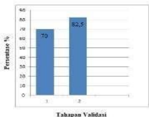
Gambar 3 Hasil Validasi media.