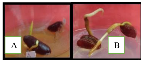
Gambar 1. Pertumbuhan akar setelah 40 hst (A) eksplan pada perlakuan kontrol (B) eksplan pada perlakuan 5 GA3

Pada penelitian ini persentase perkecambahan menghasilkan 100% untuk semua perlakuan sedangkan pada kontrol parameter perkecambahan hanya mencapai 50%. Hal ini diduga pada perlakuan kontrol kurang optimal karena pada kontrol tidak adanya penambahan zat pengatur tumbuh sehingga memungkinkan eksplan terjadinya keterlambatan dalam berkecambah dan kurangnya kemampuan hormon endogen dalam menginduksi perkecambahan dibandingkan perlakuan lainnya. Hal ini sesuai menurut penelitian Srihartanti (2019) bahwa perlakuan 3 mg/l GA3 + 3mg/l BAP mampu membentuk akar dengan persentase 75%.