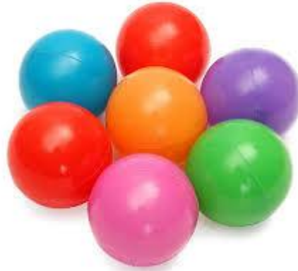
Gambar 2 bola plastik untuk peluru

Didalam peralatan permainan ini ada yang bikin menarik yaitu penambahan untuk menyerang berupa bola-bola plastik yang digunakan untuk melempar lawan, masing masing pemain hanya dibekalin 2 peluru atau bola plastik. Dan peralatan pendukung lainnya berupa; peluit, bendera, stopwacth , alat tulis.