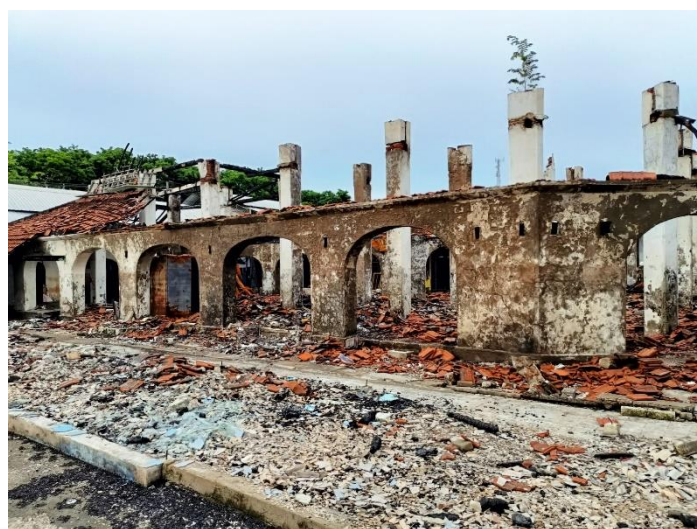
Gambar 3 Bangunan Pasar Paing Sidayu yang Terdampak Kebakaran

Bencana kebakaran yang destruktif menimpa Pasar Paing Sidayu pada tanggal 31 Januari 2022. Hal tersebut berdampak pada 75% kerusakan bangunan Pasar Paing Sidayu dengan kerusakan yang terkonsentrasi pada area sebelah timur dan selatan bangunan. Kerusakan tersebut amat disayangkan mengingat nilai penting yang terkandung pada Pasar Paing Sidayu. Maka dari itu, untuk menghindari kejadian serupa maka perlu dilakukan mitigasi yang terfokus pada bencana kebakaran dengan memperhatikan kondisi sekitar Pasar Paing Sidayu. Pasar Paing Sidayu sendiri merupakan bangunan bersejarah yang hingga zaman modern ini masih beroperasi sebagai pasar lokal.