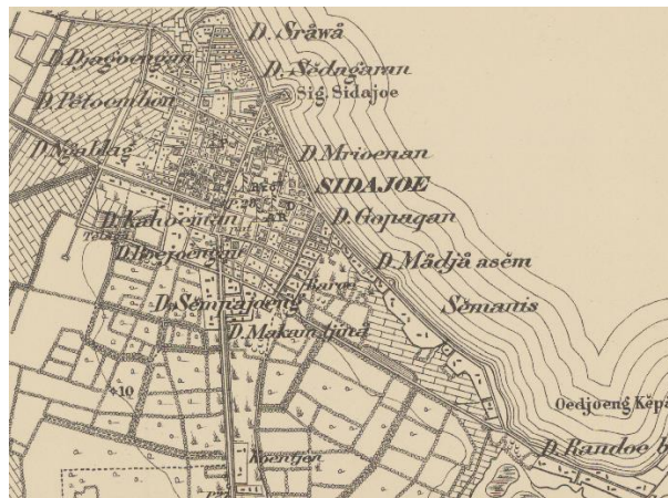
Gambar 2 Peta lokasi Sidayu dari masa Belanda

Sebagai wilayah yang terkenal dengan potensi pelabuhannya, pemerintah kolonial yang menduduki Sidayu saat itu membangun pasar sebagai sarana ekonomi. Pasar tersebut diberi nama Pasar Paing Sidayu. Pasar Paing Sidayu berfungsi sebagai tempat terjadinya kegiatan jual-beli antar saudagar dari berbagai negara. Pelabuhan Sidayu terletak di pantai utara Jawa yang merupakan salah satu garis pantai dengan banyak pelabuhan dibangun di sekitarnya. Tidak semua pelabuhan yang terletak di sepanjang garis pantai utara Jawa dilengkapi dengan fasilitas pasar, maka dari itu Sidayu sebagai kota pelabuhan yang dilengkapi fasilitas pasar dikenal oleh banyak saudagar dari berbagai negara.