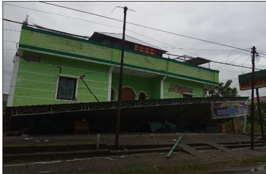
Gambar 3. Dampak kerusakan gempa bumi di kecamatan Mamuju.

Jika merujuk berdasarkan yang terjadi pada lapangan, terlihat tingkat kerusakan cukup parah terlihat pada wilayah kecamatan Mamuju seperti yang ditunjukkan pada gambar 3.