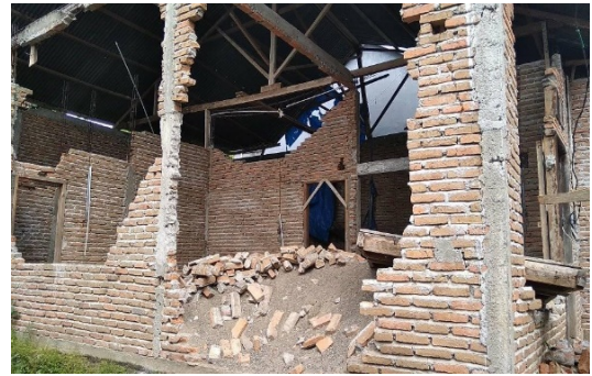
(b) Wilayah Kecamatan Tapalang dan Tapalang barat