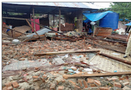
(a) Wilayah Kecamatan Simboro

Sedangkan jika merujuk berdasarkan pada wilayah kecamatan Simboro, Tapalang dan Tapalang barat yang terlihat pada gambar 4. Berdasarkan gambar 4 terlihat bahwa tingkat kerusakan yang ditimbulkan akibat kejadian gempa bumi cukup parah. Bangunan mengalami kerusakan parah, hingga tidak layak lagi ditempati, jika merujuk pada peta kontur skala intensitas guncangan wilayah ini memperoleh skala VII MMI dengan tingkat kerawanan menengah.